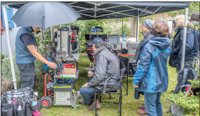
Im Garten des Grundstücks Am Herzogtore 10 wurde mächtig Filmtechnik aufgebaut. Hier besprach das Aufnahmeteam auf einem Monitor die letzte Filmsequenz. Beim Dreh waren am Montag 45 Mitarbeiter in irgendeiner Weise am Set beschäftigt.