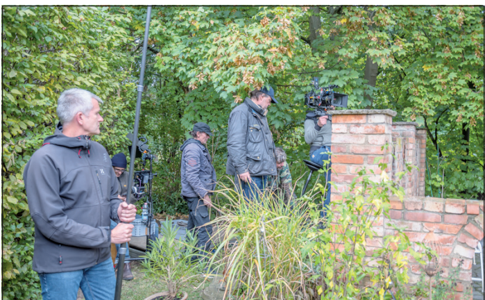
Vier Takes mit fünf unterschiedlichen Blickwinkeln wurden aufgenommen. Die Kamera- und Mikrofonstandorte wurden vorher genauestens festgelegt.